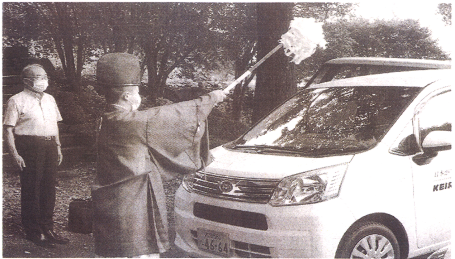
安全祈願のお祓いを行った

詳細は、ホームペー ジ ( https://www.w.pref.oita.jp/soshiki/14180/sukuhakugyoua )