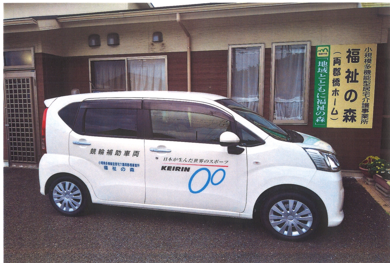
ダイハツムーブ フロントシートリフト LSAM 5ドア CVT 2WD 660cc